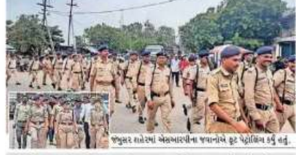
जंजुसर शहरमां अलखारपीना जवानाच्ये कूट पेट्रोलिंग कतुं कतुं.

भोट तपाम लघमजभोरो नाली कुठ्यां सतां. पनाप अंगे विराले सिगरेट भरीं इरवा आवेलां माहिर तेपच तेनी साभेना 25 वी 30 वीकोना टोणा विरूढ जंजुसर पोलीस पचो आठोपीओनी कलम 323, 143, 147, 148, 149, 504, 506(2), 307, 436 तेपच कृपी अंश 135 केडण हरियाड नोपाची कता.